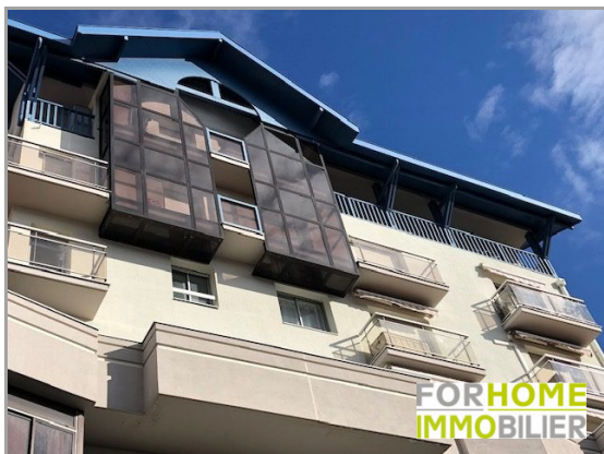
FACADE DE LA RESIDENCE